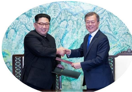
▲板門店宣言に署名し、握手を交わす両首脳

今回の南北首脳会談は、11年ぶりに開かれた首脳会談という意味を超え、朝鮮半島の平和と統一のための劇的で画期的な会談として歴史に記憶されるだろう。