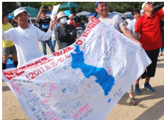
▲昨年の統一マダン生野で 統一旗を持って喜びを表現する参加者